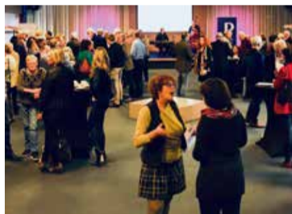
Er werden vele intensieve gesprekken gevoerd.

Het is voor Jan met de pet moeilijk om in contact te komen met de top van zijn gemeente, sociale dienst, het UWV of de Kredietbank. De communicatie met deze instellingen gebeurt vaak online, of hij komt niet verder dan de balie. De Pijler, onderdeel van Burgerkracht Limburg, bracht dit fysieke contact echter wél tot stand op 7 februari jl., tijdens de conferentie 'In gesprek met' in het Forum in Roermond.