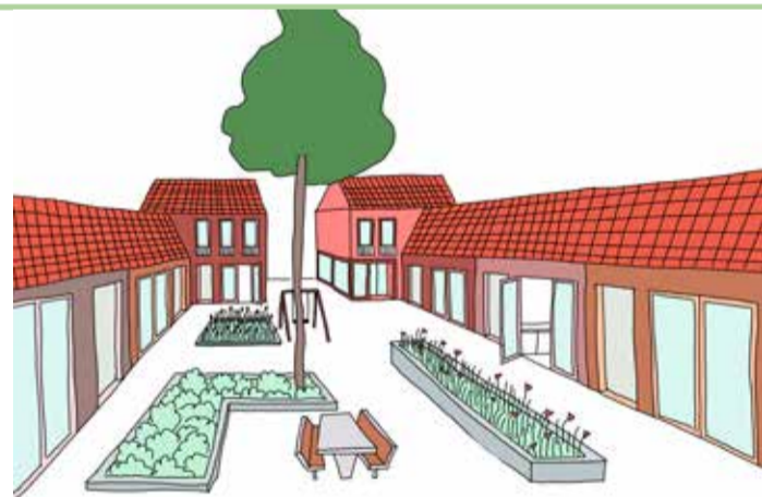
Zo ziet de hofjeswoonvorm er op papier uit.

"Het betreft mensen met verschillende culturele achtergronden. Een vaste groep, die regelmatig bij elkaar komt," aldus Chantal Saes.